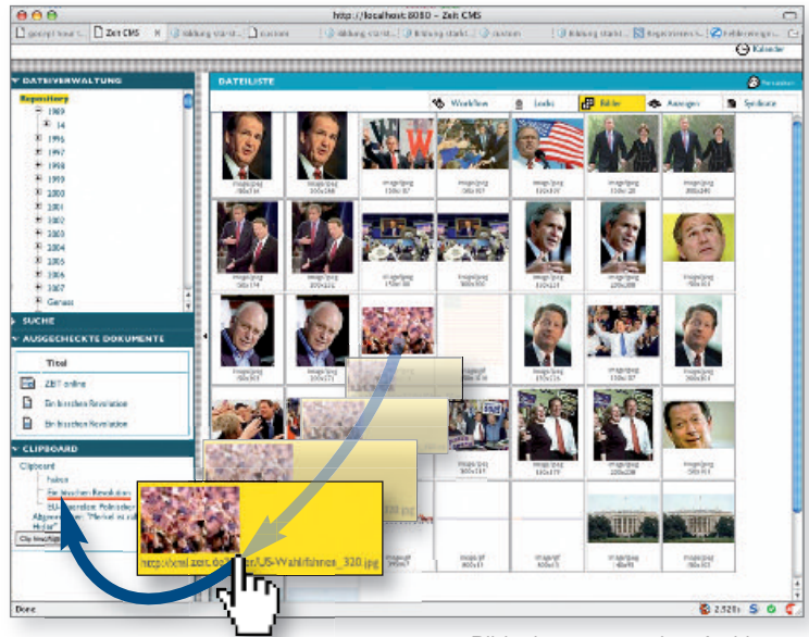
Bilder können aus dem Archiv per Drag&Drop zur weiteren Verwendung in einem Clipboard abgelegt werden.

tionen lassen sich per Drag&Drop erledigen. Zur Dynamisierung der Benutzeroberfläche kommt an vielen Stellen AJAX zum Einsatz. Jeder Redakteur kann sich seinen Arbeitsplatz individuell einrichten, da die Elemente der Benutzeroberfläche ein- bzw. ausgeklappt werden können. Alle Funktionen laufen mit hoher Performanz, sodass die von gocept entwickelte Lösung die redaktionellen Arbeitsprozesse spürbar beschleunigt. Da Zope eine der wichtigsten Schnittstellen in der Softwarelandschaft von ZEIT Online ist, in deren Weiterentwicklung mehrere IT-Unternehmen involviert sind, stellte die ZEIT auch hohe Anforderungen an die Wartbarkeit und Dokumentation des Systems.